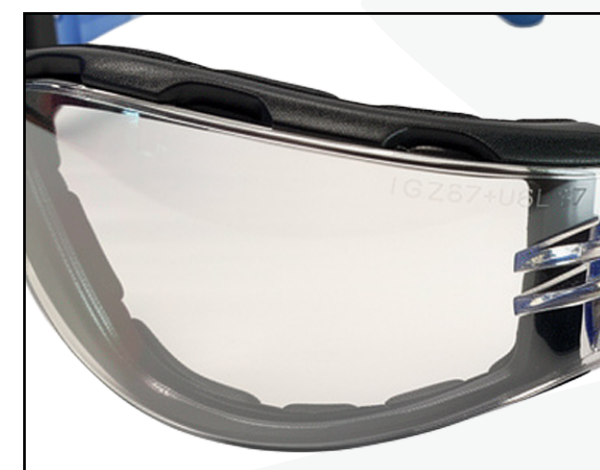
DETALLE DEL LENTE