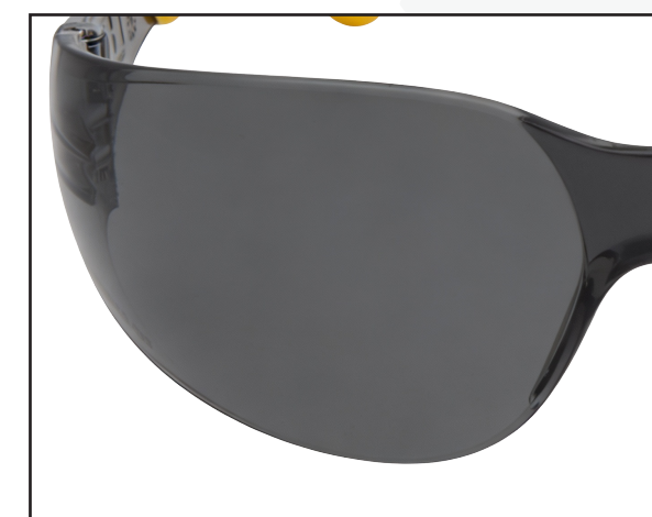
DETALLE DEL LENTE