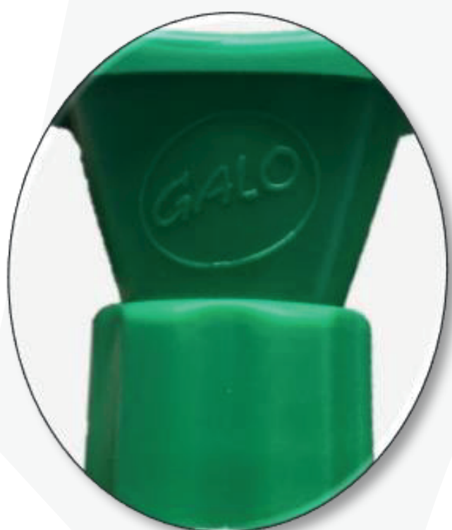
CABEZAL DE IRRIGACIÓN