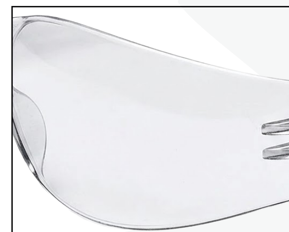
DETALLE DEL LENTE